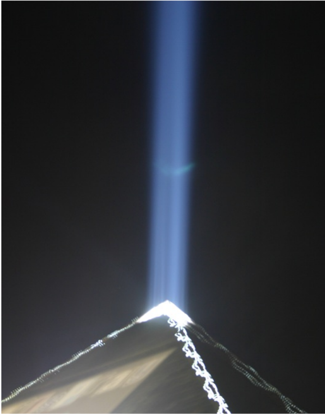
Eclairage abusif : plus futile qu'utile !

le sol, susceptibles de porter atteinte à la santé humaine ou à la qualité de l'environnement, d'entraîner les détériorations aux biens, une détérioration ou une entrave à l'agrément de l'environnement ou à d'autres utilisations légitimes de ce dernier » (rien ici concernant la pollution lumineuse ni même d'ailleurs les rayonnements nucléaires).