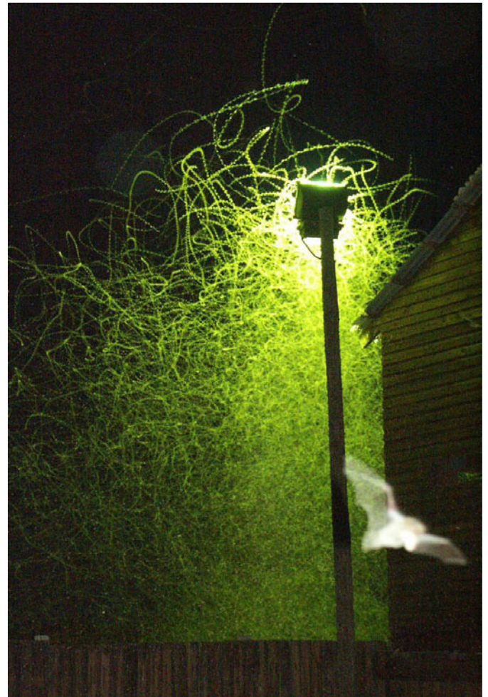
Les éclairages attirent et tuent certaines espèces

type « sky tracers » et éviter d'éclairer toute la nuit des paysages, des façades, des églises, des monuments dont l'intérêt culturel ou architectural est loin d'être évident et qui n'ont guère de spectateurs à deux heures du matin ! Des lampadaires bien conçus, dont l'ampoule encastrée dans le réflecteur n'envoie pas de lumière au-dessus de l'horizontale, sont également une solution qui permet, pour un éclairage au sol équivalent, l'utilisation d'ampoules moins puissantes. Le nec plus ultra est l'adoption de système de contrôle à distance de l'éclairage qui s'adapte à la luminosité ambiante, aux conditions climatiques et au trafic routier. Il existe aussi des solutions bon marché et au coût de fonctionnement nul, comme les signalisations routières réfléchissantes qui sont largement employées en France notamment. En matière d'éclairage « de sécurité », il vaut mieux installer des projecteurs avec détecteurs de mouvement que de laisser un éclairage brûler toute la nuit.