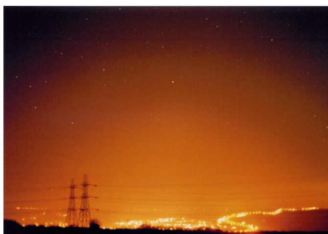
Un exemple typique de halo lumineux

Une autre étape a été franchie quand on est passé