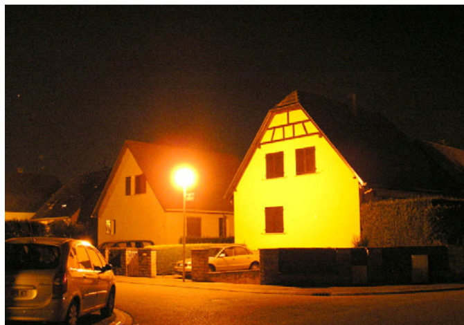
La lumière intrusive est une atteinte à la vie privée

Ces éclairages mal adaptés et/ou mal utilisés engendrent, comme le font les autres types de pollution, toute une série de problèmes. Ceux auxquels on pense en premier lieu sont le gaspillage énergétique (et financier) et donc la production inutile de CO 2 . Mais il en existe d'autres qui impactent l'être humain et l'environnement : éblouissement qui porte atteinte à la sécurité, lumière intrusive qui ne respecte pas notre vie privée et qui peut entraîner des troubles du sommeil, perte de vision de notre Univers et impact culturel que cela sous-entend, effets négatifs sur l'Environnement allant de la simple gêne apportée à la vie nocturne à la destruction de certaines espèces animales comme des oiseaux migrateurs, des tortues marines, des amphibiens ou des insectes et papillons de nuit qui disparaissent par milliards chaque année.