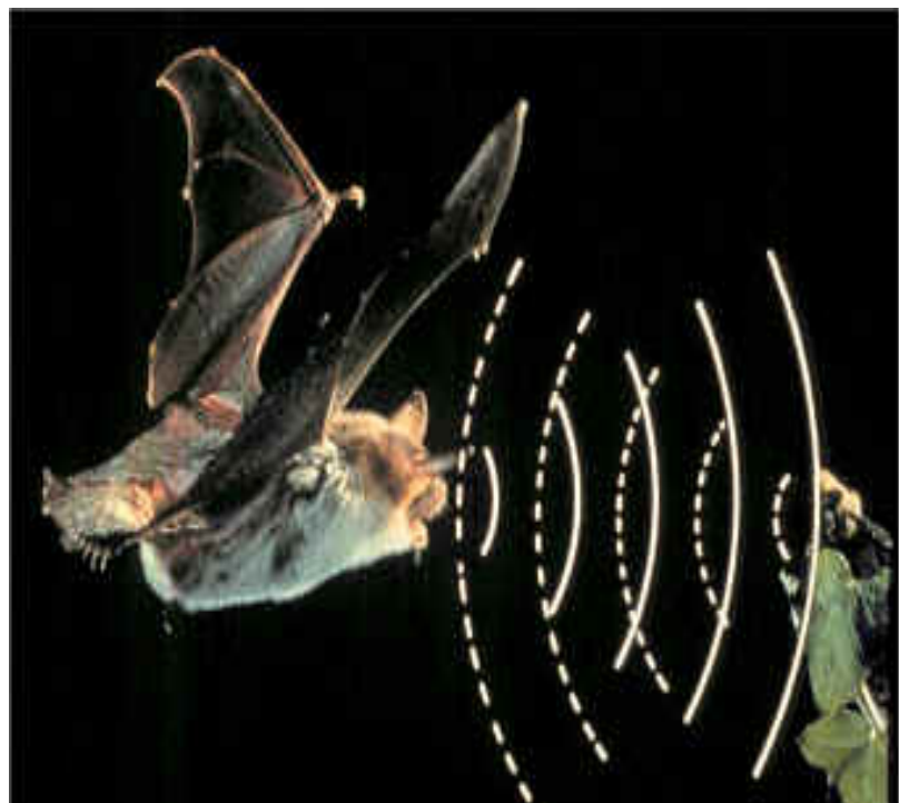
Les chauves-souris repèrent leurs proies et les obstacles dans l'obscurité grâce à leur « radar » interne : l'écholocation

à distance et sont moins importants que chez les mammifères diurnes.