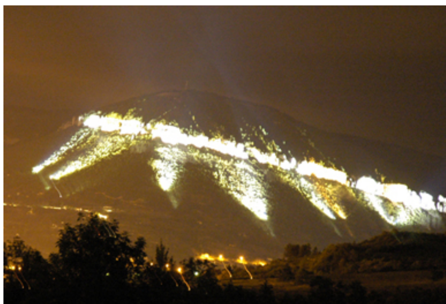
Éclairer les falaises où se trouvent des grottes chasse les chauves-souris de leurs habitats

Ce comportement n'est pas vrai pour toutes les espèces de chauves-souris. Les grandes espèces ailées dont le vol est plus lent comme les chauves-souris à longues oreilles, les Myotis et