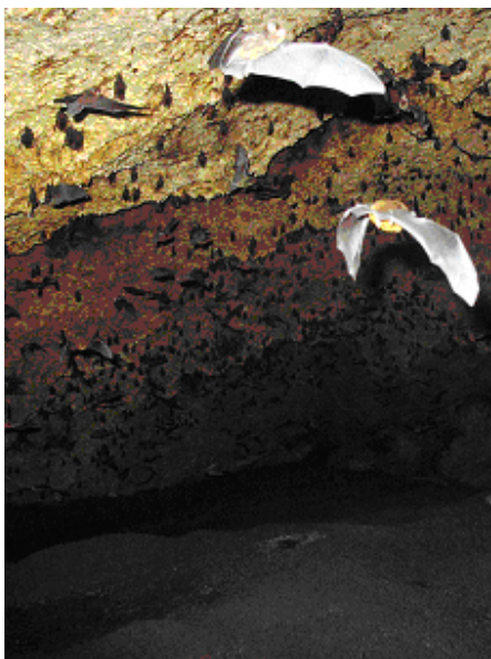
Les grottes constituent des habitats courants pour les chauves-souris

En Europe, les chauve-souris utilisent deux types de gîtes : un pour l'hiver (cavité sombre sans courant d'air avec une température et surtout une hygrométrie stable, où se mêlent mâles et femelles de plusieurs espèces pour hiberner suspendues au plafond) et un pour l'été (les mâles isolés ça et là dans les fissures de mur, toit, pont, cave ou écorce d'arbre et les femelles groupées en grande nurserie d'une même espèce dans un lieu très chaud sans courant d'air comme les combles, écurie ou tunnel d'égoût). On peut donc les retrouver dans différents habitats :