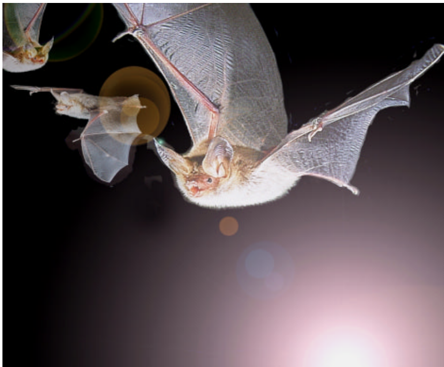
La plupart des chauves-souris supportent mal les éclairages nocturnes