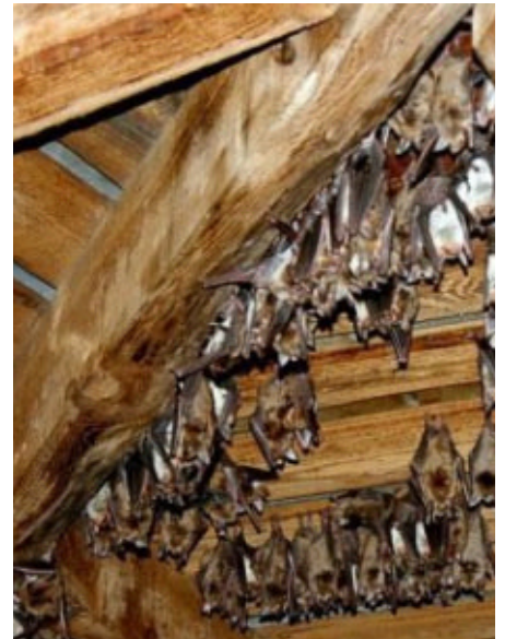
Ainsi que les charpentes que l'on peut trouver par exemple dans les combles et les clochers

Une bonne connaissance de leurs exigences écologiques permet déjà de préserver leurs gîtes traditionnels d'hibernation connus en particulier