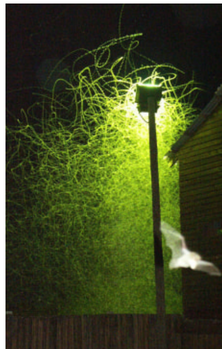
Les lumières attirent les insectes, ce qui peut paraître un avantage pour les chauves-souris, mais constituera à terme un handicap par la disparition trop rapide des proies

se fait souvent en dépit du bon sens. On n'a pas besoin de mettre des tonnes de watts pour éclairer un bâtiment ! Au-delà de la gêne engendrée au niveau de la faune, cette mauvaise gestion de l'éclairage entraîne parfois des coûts financiers démesurés pour les communes.